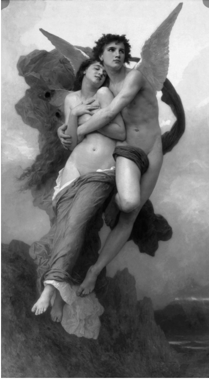
Resim 1. Yunan mitolojisinde aşk tanrısı olan Eros, ruhun kişileştirilmiş hali olan gözleri kapalı Psykhe'yi kollarında taşıyor. Âşık olduğumuz zaman, ruhlarımız, Eros'un kanatlarında gözleri bağlı halde havalanır.

yaptı. Psykhe'nin uyması gereken tek bir kural vardı: Eros'u asla görmeyecekti. Psykhe kendine hâkim olamayarak, bir gece elinde mumla, uyanan kocasına bakacak oldu; fakat Eros'un güzelliğinden gözleri kamaştığı için eli titredi. Yanan mumdan akan kızgın bir damlayla uyanan Eros, karısının kabahatini anlayınca ortadan kayboldu. Kocasına umutsuzca âşık olup onu geri kazanmaya karar veren Psykhe, aralarında Aphrodite'in de bulunduğu tanrıları yardıma çağırırdı. Çeşitli girişimlerden ve sıkıntılardan sonra, aşk tanrısını kendisinin bile geri çeviremeyeceğini anlayan tanrıların tanrısı Zeus'un (İupiter) yardımıyla, Psykhe ölümsüzlüğe kavuştu;