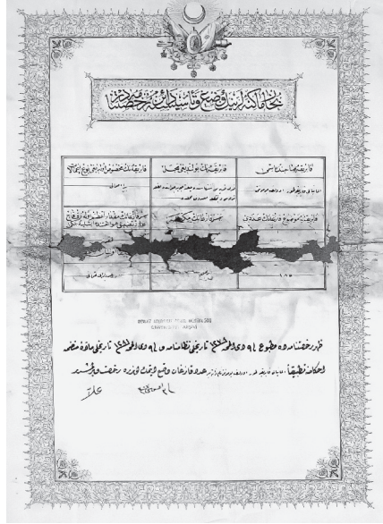
Bomonti Bira Fabrikası'nın 15 Ağustos 1891 tarihli ruhsatı. 28