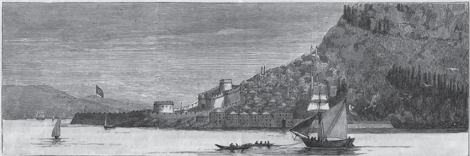
KILIT BAHR, ON THE EUROPEAN SHORE

THE RUSSO-TURKISH WAR—THE KEY OF THE DARDANELLES