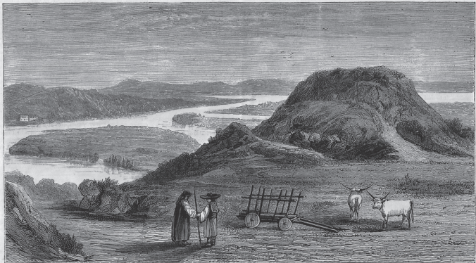
THE RUSSO-TURKISH WAR—CAPUT BOVIS AND THE JUNCTION OF THE SERETH WITH THE DANUBE

THE RUSSO-TURKISH WAR—THE KEY OF THE DARDANELLES