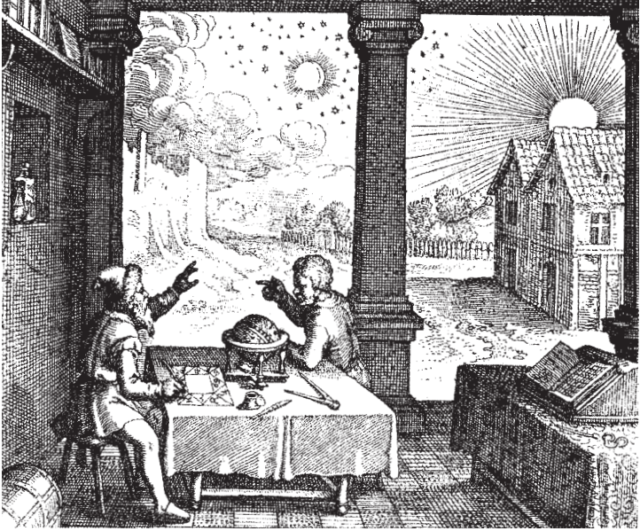
17. yüzyılın başlarında astrolog Robert Fludd'ın yazdığı bir kitabın Yıldız Falı'ndan söz eden bölümünden... Geleceği Görmek .