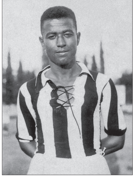
Altay’ın hem kaptanı hem ruhu, futbolumuzun “Kara İncisi” Vehâb Bey.