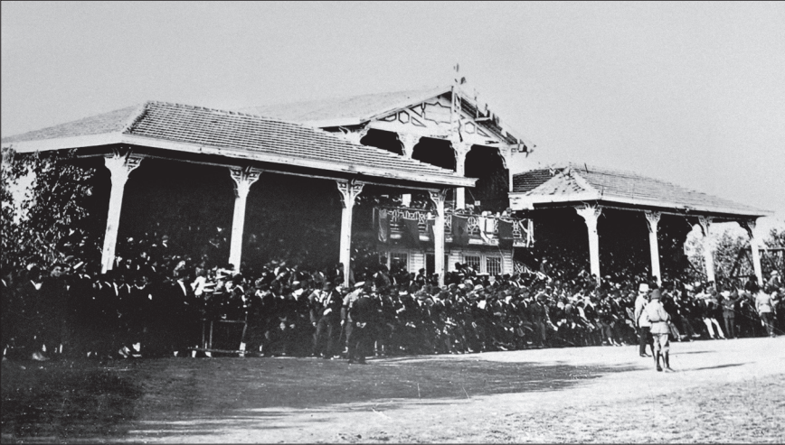
Eski adı Union Club yeni adı İttihadspor Sahası olan sonra da Fenerbahçe Stadyumu hâline getirilen stadin muazzam tahta tribünleri...

– O kadar naif ve şiirsel yazmışsınız ki; her ikisinden de birkaç parça alıp okumak istiyorum.