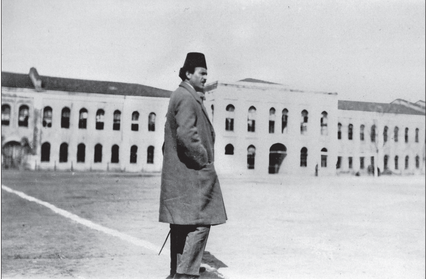
Türkiye İdman Cemiyetleri İttifakı Reisi Ali Sami Bey, Taksim Stadyumu'nu teftiş ederken...