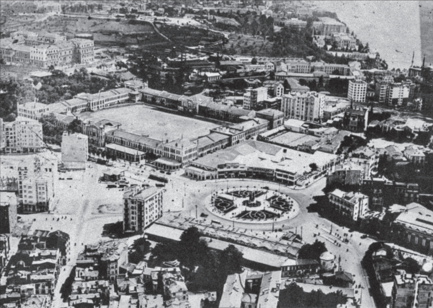
Otuzların hemen başında Taksim Meydanı, bahçesi ve stadyumu...