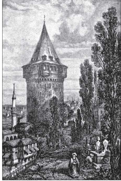
Galata Kulesi'nin 1794 harikinden mukaddem (yangınından evvel) yapılmış resmi. (Evveliyâtı da külâhlıymış).