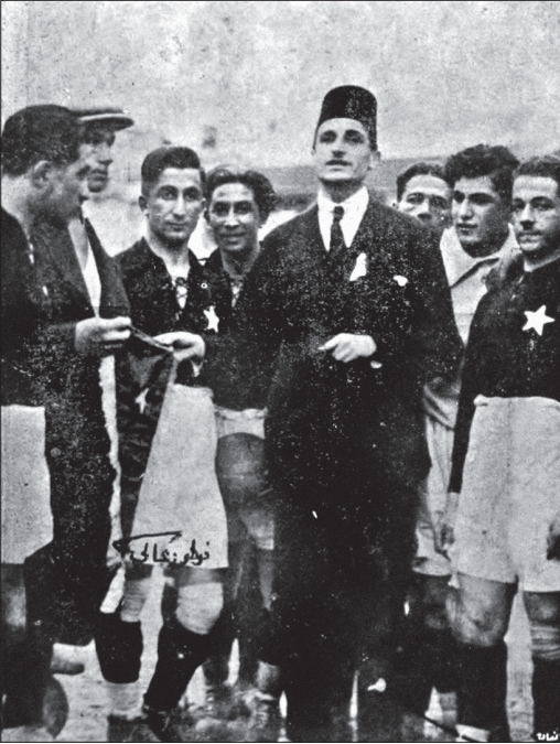
Beşiktaş futbolunun müessisi ve İstanbul Mıntıkası Reisi Ahmed Şerafettin Bey bir müsabakadan evvel nutuk irâd ederken.

şey öğrenmiş olduğumu düşündüm. Bu malûmatı kitabıma yazacağım için çok heyecanlıydım. Eve dönüş yolunda kendi kendime konuştum galiba: