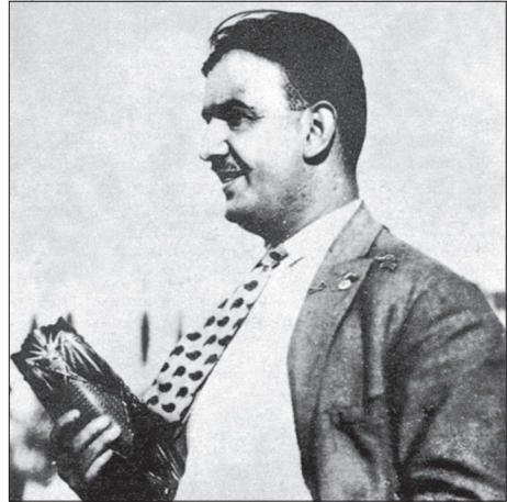
Futbol Federasyonu Heyet-i Müttehide'sinin ilk reisi Yusuf Ziya Bey.